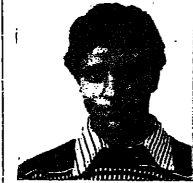
صحي عودة - سجل اصابة عكسية لصالح مكابي هشرورن . . . معليش المهم الدوري . .

جرت اول امس مباريات التصفيات للفوز بكأس الدولة فيكرة القدم للجولة الثانية باشتراك فرق الدرجة الثالثة والرابعة التي تمكنت من الوصول الى هذه المرحلة من المباريات وانضمت اليها فرق الدرجة الثانية وعددها 16 فريقا من الوسط العربي .